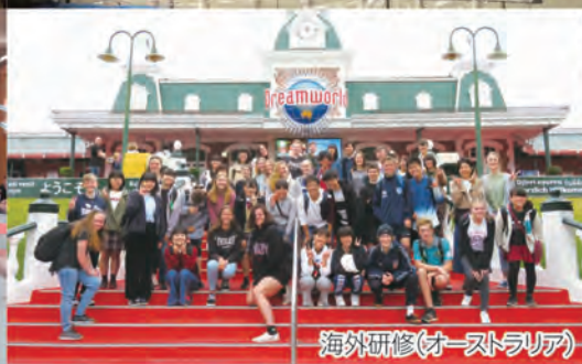
海外研修(オーストラリア)