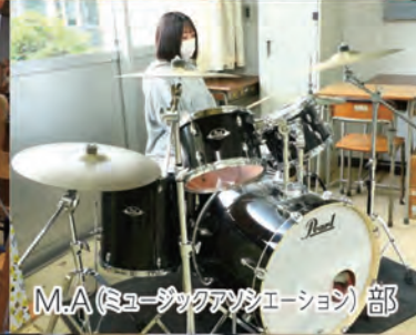
M.A (ミュージックアソシエーション) 部