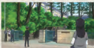
提供 © ひぐちアサ / 講談社 / おお振り制作委員会

西高で過ごした3年間は、とても濃いものでした。強い個性の集まる学校で、部活や生徒会で押し合いへし合いしながら世界を広げ、挫折も味わいました。挫折はがんばった人しか味わえませんか、大事な思い出です。今でも時々寄らせてもらいますが、高校生たちの元気の良さは私のいた頃と変わりません。みなさんも、濃い友人と濃い高校生活を、有意義に過ごせますように！